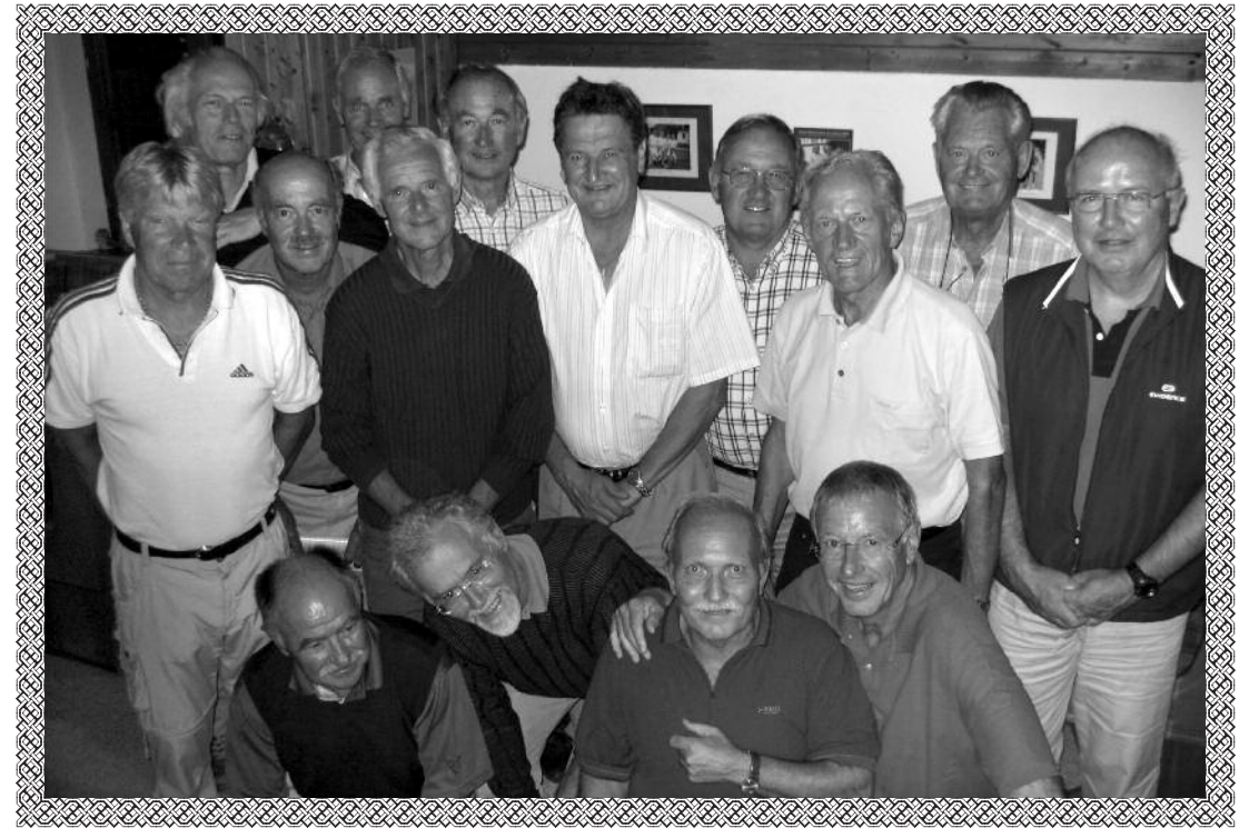
Die erfolgreichen Aufsteiger der Herren 60 II und 65 beim gemeinsamen Grillabend mit Damen am 12. August 2008 im Clubheim. Fast 30 Teilnehmer erlebten einen geselligen Abend bei viel Eigenleistung ( unser Wirt war in Urlaub, hat aber vorbereitet und Indra war da) und großartiger Stimmung.