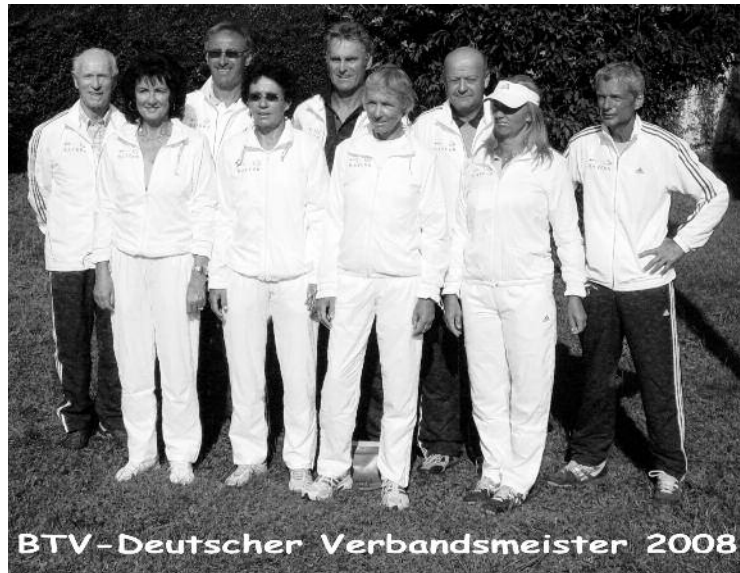
BTV-Deutscher Verbandsmeister 2008