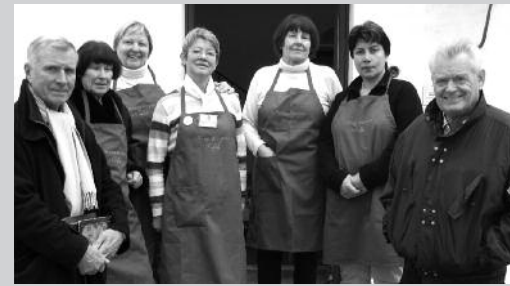
Die freundlichen Damen der Herrschinger Tafel haben sich extra noch frische Schürzen umgebunden